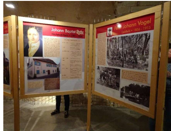
Die Entdecker-Ausstellung informiert über fünf Naturforscher aus dem Aischgrund.

Erste Projekte: In der Vorstandssitzung vom 24. Oktober 2023 beschloss der Vorstand die ersten Projekte der neuen LEADER-Förderperiode 2023-2027: einen Inklusionsspielplatz in Neustadt, ein Nutzungs- und Betriebskonzept für die ehemalige Synagoge in Mühlhausen sowie eine Bikepark-Anlage für Wachenroth. Im Rahmen des Bürgerengagements wurde das Leichensteinfeld Herrneuses-Schellert bewilligt, das an einen alten Brauch bei Begräbnissen erinnert.